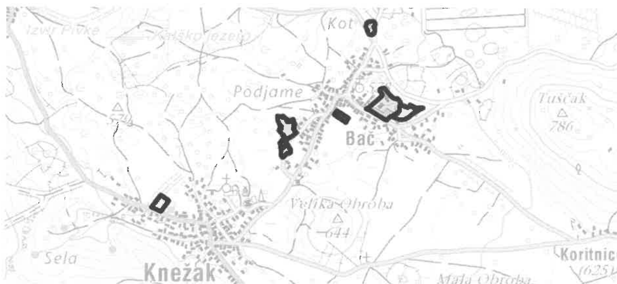
Območja: BA04, BA06, BA07/1, BA07/2, BA10, BA22, KN07