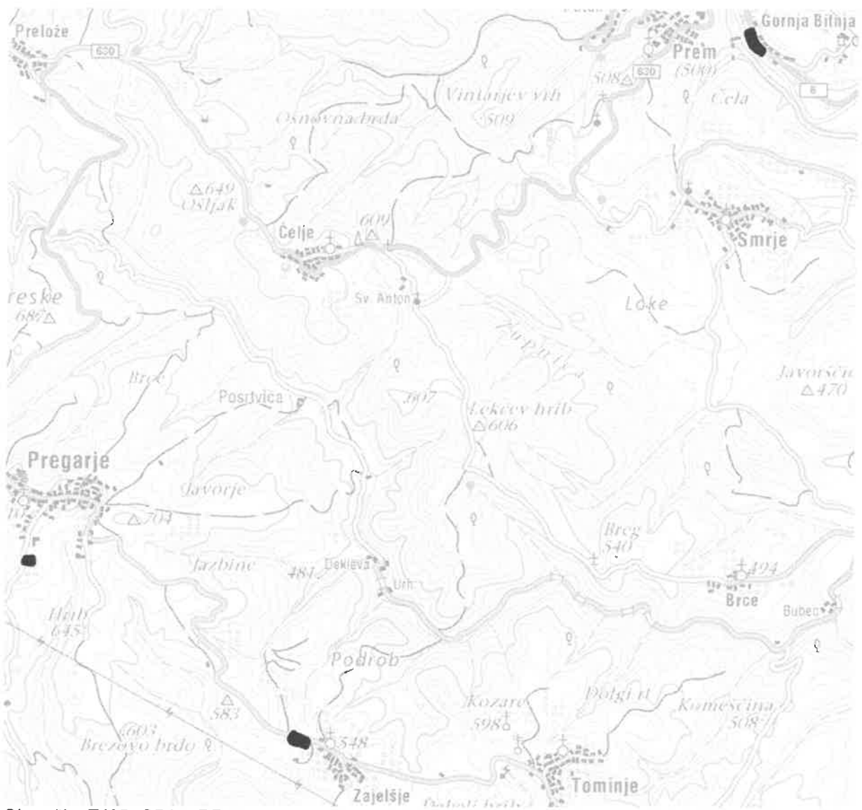
Območja: ZJ05, GB05, PR09