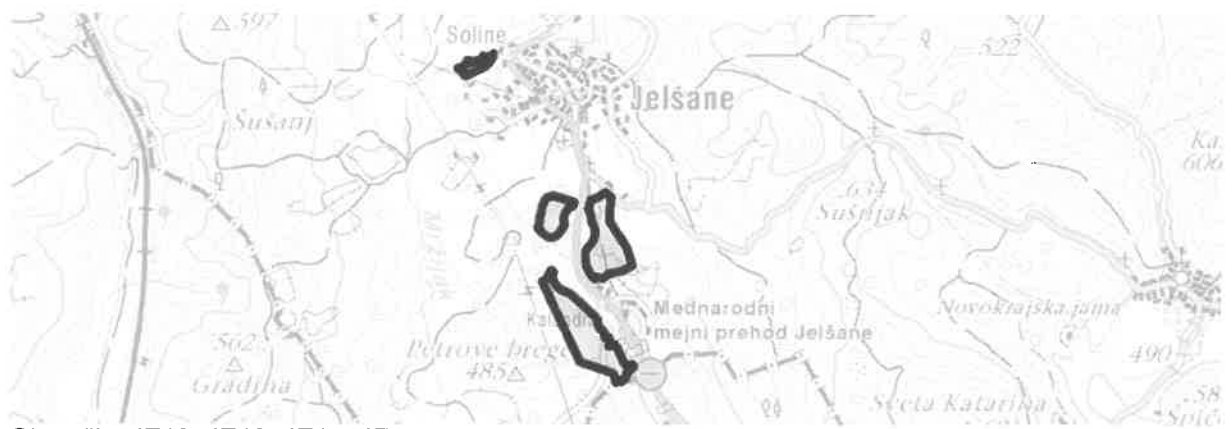
Območja: JE12, JE13, JE15, JE14